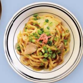
22日昼食・三重県 亀山風味噌焼きうどん