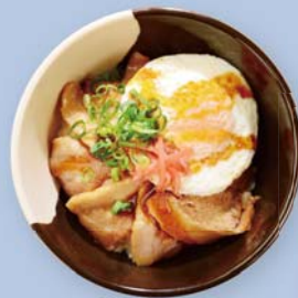
9日昼食・愛媛県 今治焼豚玉子飯